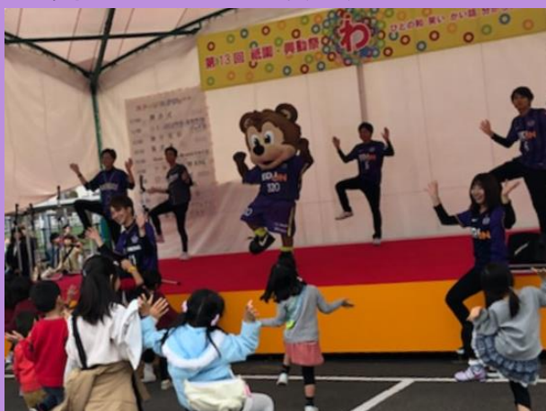
来場者とサンチェたいそうを踊るサンチェくん

今回のイベントは、今年の興動祭のテーマでもある「わ」が広がった魅力あるお祭りとなった。また、イベントを通して改めて多くのファンに愛されていることを肌で感じた。これを機に、さらに多くの人々に「わ」が広がってほしい。